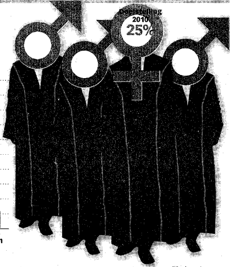
Percentage vrouwelijke hoogleraren in de EU